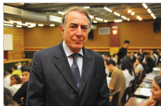
Na última semana, o professor Francisco Rezek abriu o ciclo de palestras do semestre com o tema Guerra contemporânea: Direito Internacional . O professor ministrará mais três palestras no UniCEUB, durante o primeiro semestre de 2009. Consulte a programação completa no site da Instituição.